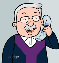
Phán quyết của tòa

Gần đây số gia đình ly hôn đang ngày càng tăng lên. Những cặp vợ chồng đó trải qua quá trình hết sức khó khăn và dẫn tới ly hôn. Họ nỗ lực vì cuộc sống mới và đặc biệt trong trường hợp họ có con chưa thành niên thì họ vẫn được gọi với cái tên “Bố Mẹ” cho dù là sau ly hôn và họ phải lo lắng liệu họ có thể nuôi dưỡng tốt được con cái hay không.