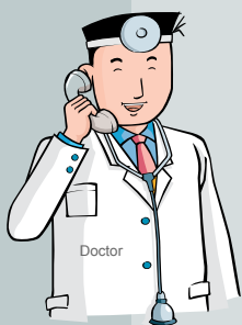
Lời khuyên của bác sĩ

Những cặp vợ chồng có con cái chưa trưởng thành không kể là thuận tình ly hôn hay ly hôn do tòa phán xử, họ phải thoả thuận với nhau về những nội dung liên quan tới việc nuôi dưỡng con cái (Luật dân sự điều 843, điều 837). Tiêu chuẩn quyết định vấn đề nuôi dưỡng con cái phải dựa trên lợi ích và hạnh phúc của trẻ. Không được dựa theo tham vọng và sự tiện lợi của bố mẹ.