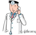
ผู้เชี่ยวชาญ

วัยรุ่นเป็นวัยที่มีความเปลี่ยนแปลงทางอารมณ์มาก และถ้าเห็นการหย่าของพ่อแม่ อาจจะมีปัญหาในเรื่องของการเรียน หรือมีการต่อต้าน อากาารซึมเศร้า หรืออยากฆ่าตัวตาย และบางครั้งเด็กอาจจะพยายามทำหน้าที่แทนผู้ปกครองที่ขาดหายไป เช่น ตั้งใจเรียนมาก ดูแลการงานในบ้าน