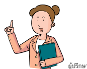
ผู้ปรึกษา

แม้ว่าลูกจะเป็นเด็กดี เด็กไร้เดียงสา หรือเด็กแสบแต่แต่ถึงอย่างไรคุณก็คือพ่อแม่ 'อย่าโยนหน้าที่ต่างๆ ของการเป็นพ่อแม่ให้กับลูก แต่คุณควรจะทำหน้าที่การเป็น 'พ่อแม่' หากคุณใส่ใจกับลูกของคุณแล้ว วันหนึ่งเด็กจะหันกลับมาทำหน้าที่ "ลูกของคุณ" เอง