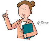
ผู้ปรึกษา

และกรณีที่พ่อหรือแม่ที่เป็นผู้ดูแลเด็กมีความโกรธหรือความเศร้าจากการหย่าจะทำให้เด็กมีพัฒนาการช้าและตอบสนองต่อการกระตุ้นล่าช้าหรือสมองเสื่อมได้