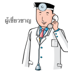
ผู้เชี่ยวชาญ

การหายไปของพ่อหรือแม่ เทียบได้เท่ากับภัยพิบัติทางธรรมชาติ การตัดสินใจเรื่องหย่าของพ่อแม่ต้องฟังความคิดเห็นของเด็กด้วย