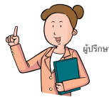
ผู้ปรึกษา

สำหรับผู้ปกครองที่ไม่ได้ดูแล การพาลูกไปนอนด้วยกั นที่บ้านดีกว่าการพาลูกไปกินข้าวข้างนอกหรือพาไปห้างสรรพสินค้า การเอาใจใส่ดูแลลูกจะทำให้ลูกรู้สึกสบายใจ และไม่กลัวพูดโกหก และสำหรับพ่อแม่ที่ไม่ได้เจอลูกเป็นเวลานาน การป้อนข้าว อบน้ำ ใส่เสื้อผ้าให้ลูกนั นดีกว่าการซื้อของขวัญชิ้นใหญ่ให้ลูกด้วยซ้ำ