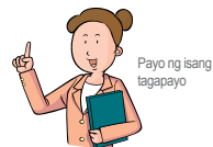
Payo ng isang tagapayo

Ito ay upang siguraduhin na ang inyong anak ay matatamasa ang kanyang pagkabata.