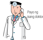
Payo ng isang doktor

Ipaalam din sa mga bata ang inyong pakikipagrelasyon sa ibang tao sa tamang paraan.