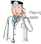
Payo ng doktor

Dahil sa pagbibinata o pagdadalaga, ang mga kabataan ay kadalasang emosyonal at sensitibo. Ang mga kabataan na may mga magulang na nagdidiborsyo ay kadalasang nagkakaproblema sa kanilang pag-aaral, nagiging suwail, nakakaranas ng depresyon at minsan magtatangka sila na magpakamatay.