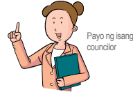
Payo ng isang councilor

Minsan din ang mga bata ay nag-aasal matanda na kung saan ginagawa nila ang kanilang makakaya upang protektahan ang kanilang mga magulang.