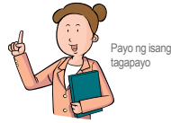
Payo ng isang tagapayo

Dahil sa murang edad, mas sensitibo ang mga bata kapag may tensyon at away sa paligid nila. Kapag ang mga magulang ay nag-aaway ng matindi o di kaya'y biglang nawawala ang isa sa kanilang mga magulang, ang mga sanggol ay nakakaranas ng sobrang pagkatakot at pag-aalala.